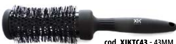
cod. XIKTC43 - 43MM