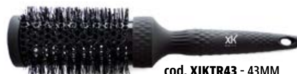
cod. XIKTR43 - 43MM