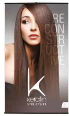
Banner em tecido para parede Banner em tecido para pared 120cm x 70cm