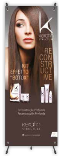
Banner / Pancarta 160cm x 60cm

12ml + 12ml (45pcs) - pcs 4/BOX cod. 5120