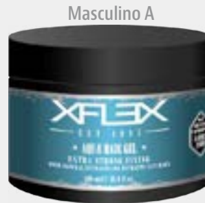
AQUE HAIR GEL cod. 2262