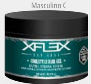
COOLSTYLE HAIR GEL cod. 2263