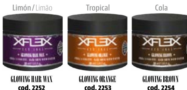
GLOWING HAIR WAX cod. 2252

Efecto EXTRA BRILLANTE fijación media. Cera de agua Efeito EXTRA BRILHANTE fixação média. Cera de água 100ml - pcs 24/box