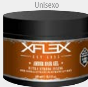
AMBER HAIR GEL cod. 2264