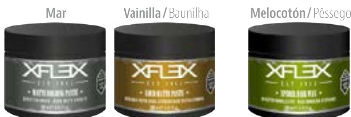
MATTE HOLDING PASTE cod. 2258

Efecto MATE fijación máxima. Cera de arcilla Efeito MATE fixação máxima. Cera de argila 100ml - pcs 24/box