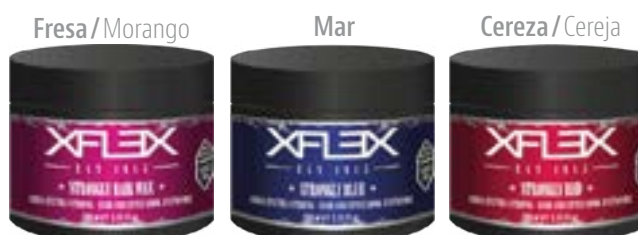
STRONGLY HAIR WAX cod. 2255

Efecto BRILLANTE fijación máxima. Look creativo Efeito BRILHANTE fixação máxima. Look criativo 100ml - pcs 24/box