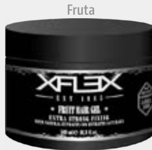
FRUIT HAIR GEL cod. 2261

MÁXIMA FIJACIÓN MÁXIMA FIXAÇÃO 500ml - pcs 12/box