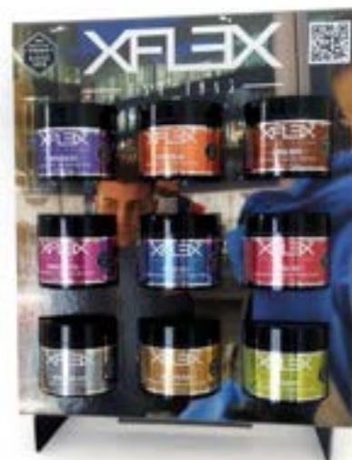
cod. GX20 Expositor cartón/mostrador Expositor de cartão/balcão (sin/sem produtos) 38cm x 29,5cm x 11cm