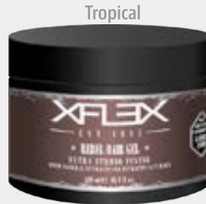
REBEL HAIR GEL cod. 2265