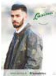
CARTAZ cod. POSTERPEQLUX (70cm x 50cm)