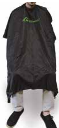
PENTEADOR cod. GL15 (150cm x 150cm)