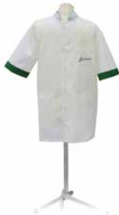
BATA MANGA CURTA cod. J2401 TAM. 38 / 40 / 42 / 44 / 46