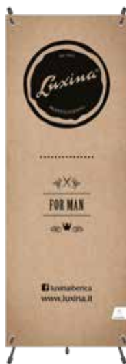
X-BANNER cod. BANNERLUX (160cm x 60cm)