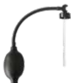
BOMBA PULVERIZADORA cod. GL40