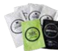
AMOSTRAS DE PRODUTOS Beard Washing 7ml cod. GL08 Beard Oil 3ml cod. GL09 Expression Cream 3ml cod. GL29 Purify Champô 8ml cod. GL35 Purify Mask 6ml cod. GL36 Beard Oil Canapa 3ml cod. GL45 Shaving Gel Canapa 7ml cod. GL46