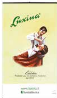
BANNER TECIDO PARA PAREDE cod. BANNERLUXINA (120cm x 70cm)