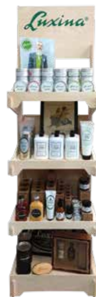
EXPOSITOR DE MADEIRA (sem produtos) cod. GL41 (170cm x 48cm x 36,5cm)

NOTA: as imagens podem variar com novas produções.