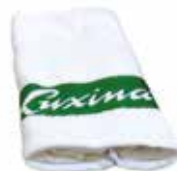
TOALHA cod. GL25