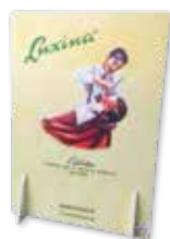
DISPLAY EM PVC A4 cod. LUXEXP02