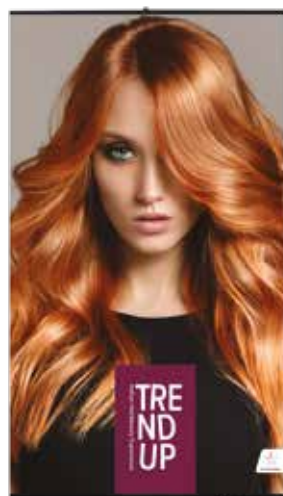
BANNER EM TECIDO PARA PAREDE cod. BANNERTUP2 (120cm x 70cm)