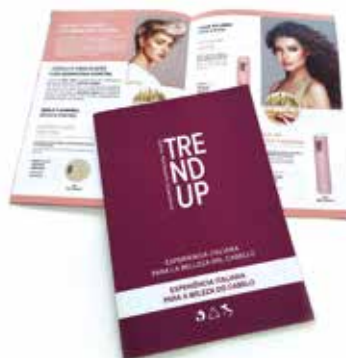
CATÁLOGO A4 PRODUTOS