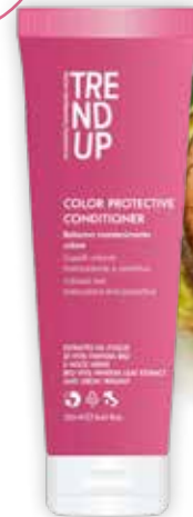
250ml cod. 0359 pcs 12/box