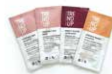
AMOSTRAS DE PRODUTOS