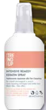
200ml cod. 0305 pcs 12/box