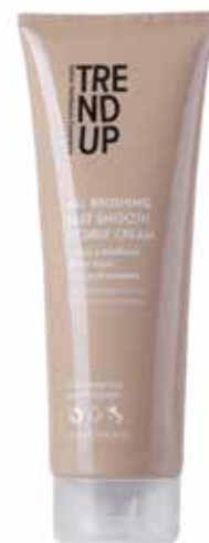
250ml cod. 0319 pcs 12/box

Aplicar em cabelo húmido ou seco, sem enxaguar.