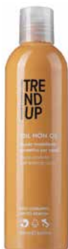
250ml cod. 0316 pcs 24/box

Aplicar em cabelo húmido ou seco, sem enxaguar.