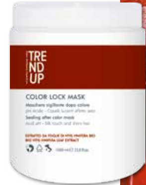
1000ml cod. 0303 pcs 12/box