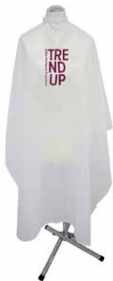
PENTEADOR cod. PENTEADTUP (130cm x 140cm)