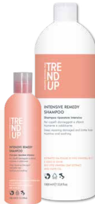
300ml cod. 0334 pcs 12/box