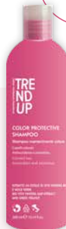
300ml cod. 0358 pcs 12/box