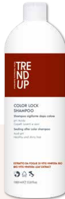
1000ml cod. 0302 pcs 12/box