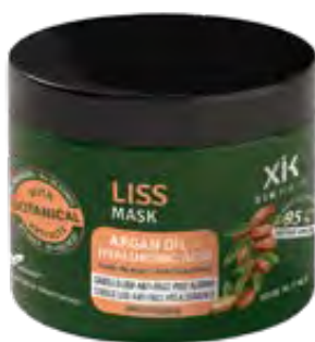
MÁSCARA 500ml (110446A) pcs 12/box