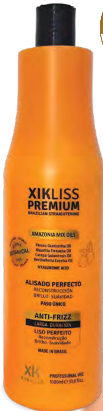
1000ml (1104016) pcs 6/box