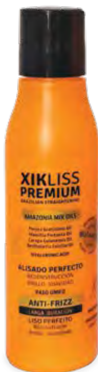
120ml (1104015) pcs 20/box