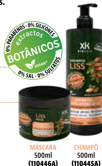
MÁSCARA 500ml (110446A)