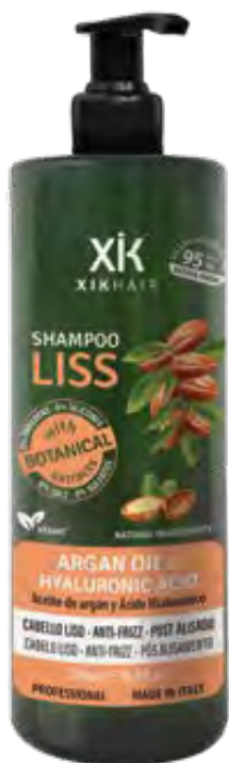
CHAMPÔ 500ml (110445A) pcs 12/box

0% parabenos, 0% siliconas, 0% sal, 0% sulfatos. 0% ingredientes de origen animal.