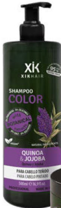
CHAMPÔ 500ml (110407A) pcs 12/box

XIK HAIR BOTANICAL LINE 95 UP TO % NATURAL ORIGIN