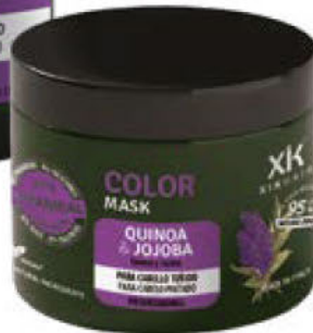
MÁSCARA 500ml (110413A) pcs 12/box