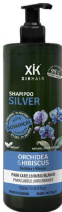
CHAMPÔ 500ml (110421A) pcs 12/box

0% parabens, 0% silicones, 0% sal, 0% sulfatos. 0% ingredientes de origem animal.