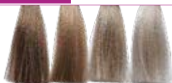
7.12 Louro Pérola 8.12 Louro Claro Pérola 9.12 Louro Claríssimo Pérola 10.12 Louro Platino Pérola