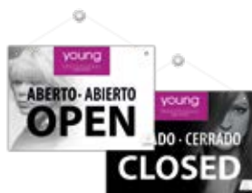
PLACA ABERTO/FECHADO cod. PLACAY