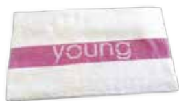
TOALHA BLANCA (50cm x 80cm) cod. TOALHAYOUNG