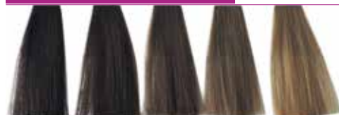
5.0 Castanho Claro Intenso 6.0 Louro Escuro Intenso 7.0 Louro Intenso 8.0 Louro Claro Intenso 9.0 Louro Claríssimo Intenso