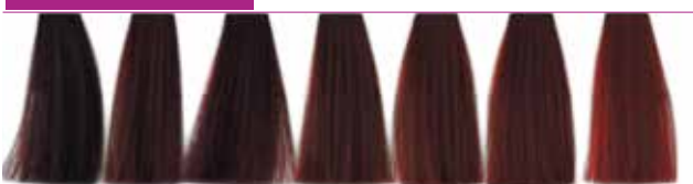
3.6 Castanho Escuro Vermelho 5.6 Castanho Claro Vermelho 5.62 Castanho Claro Vermelho Irise 6.6 Louro Escuro Vermelho 6.64 Louro Escuro Vermelho Cobre 6.66 Louro Escuro Vermelho Intenso 7.66 Louro Vermelho Intenso