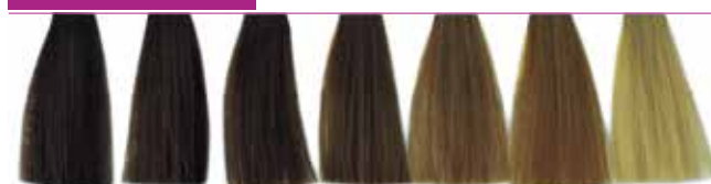
4.3 Castanho Dourado 5.3 Castanho Claro Dourado 6.3 Louro Escuro Dourado 7.3 Louro Dourado 8.3 Louro Claro Dourado 8.33 Louro Claro Dourado Intenso 9.3 Louro Claríssimo Dourado