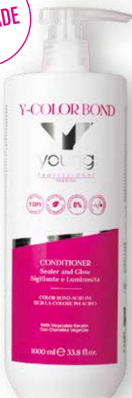
CONDICIONADOR 1000ml (0829) pcs 12/box