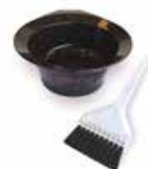
TAÇA cod. GY35 PINCEL cod. GY36