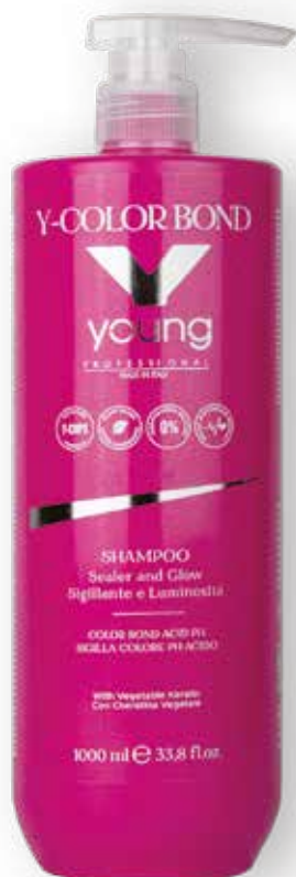
CHAMPÔ 1000ml (0828) pcs 12/box