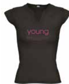
T-SHIRT cod. TSHIRTYOUNG S/M/L/XL