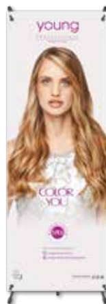
X-BANNER DE CHÃO cod. BANNERYOUNG (160cm x 60cm)