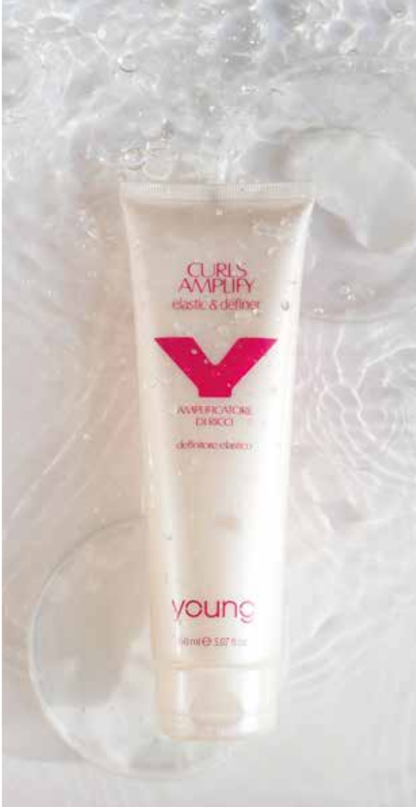
CURLS AMPLIFY 150ml (0808) pcs 12/box