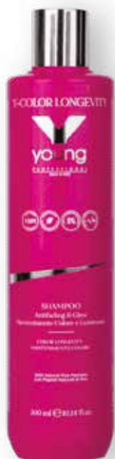
CHAMPÔ 300ml (0830) pcs 12/box