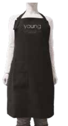
AVENTAL Tam. único cod. 2155