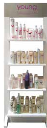
EXPOSITOR MADEIRA (SEM PRODUCTOS) cod. GY01 (170cm x 65cm x 30cm)