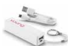
BATERIA EXTERNA cod. SMK4955