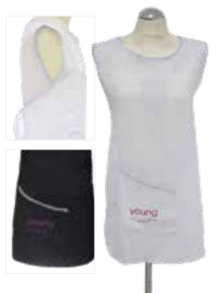
BATA - Tam. único Preto cod. 2821B Branco cod. 2821