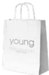
SACO DE PAPEL cod. YSACO