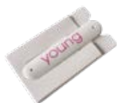
MULTIUSOS TELEMÓVEL cod. MULTI