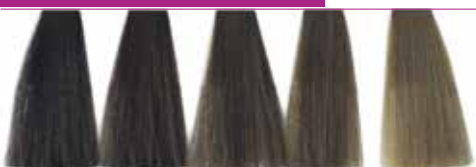
4.01 Castanho Frio 5.01 Castanho Claro Frio 6.01 Louro Escuro Frio 7.01 Louro Frio 8.01 Louro Claro Frio