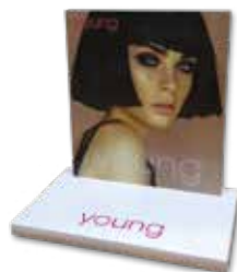
EXPOSITOR DE CARTÃO cod. GY30 (33cm x 33cm x 20cm)