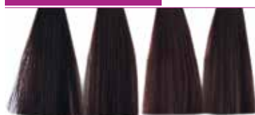
4.5 Castanho Mogno 5.5 Castanho Claro Mogno 5.56 Mogno Vermelho 6.5 Louro Escuro Mogno