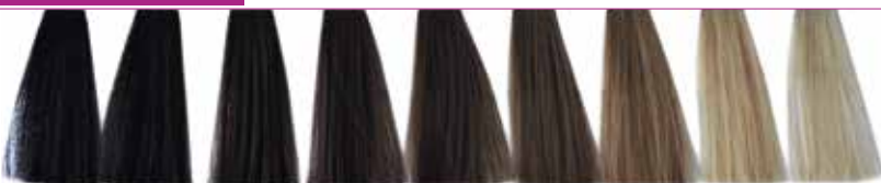
1 Preto 3 Castanho Escuro 4 Castanho 5 Castanho Claro 6 Louro Escuro 7 Louro 8 Louro Claro 9 Louro Claríssimo 10 Louríssimo Platina