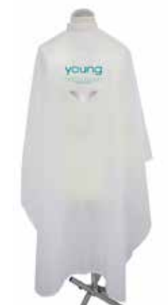
PENTEADOR 130cm x 140cm cod. PENTEADYOUNG