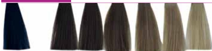
1.1 Preto Azul 5.1 Castanho Claro Cinza 6.1 Louro Escuro Cinza 7.1 Louro Cinza 8.1 Louro Claro Cinza 9.1 Louro Claríssimo Cinza 10.1 Louríssimo Cinza Intenso