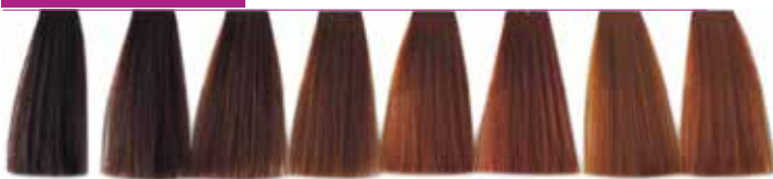
4.4 Castanho Cobre 5.4 Castanho Claro Cobre 6.4 Louro Escuro Cobre 7.4 Louro Cobre 7.44 Louro Cobre Intenso 7.46 Louro Cobre Vermelho 8.4 Louro Claro Cobre 8.44 Louro Claro Cobre Intenso