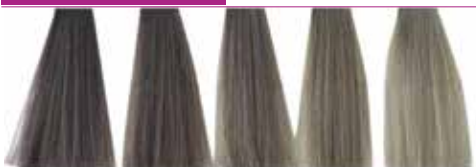
6.11 Louro Escuro Cinza Intenso 7.11 Louro Cinza Intenso 8.11 Louro Claro Cinza Intenso 9.11 Louro Claríssimo Cinza Intenso 10.11 Louro Platina Cinza Intenso