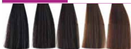
4.89 Café 5.89 Café Claro 6.89 Caramelo 7.83 Ambar Dourado 7.84 Ambar Cobre