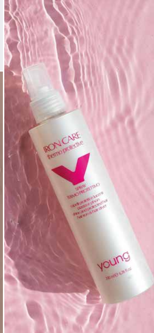
IRON CARE 200ml (0810) pcs 12/box